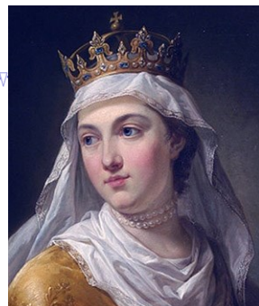
KROLOWA (ŚWIĘTA) JADWIGA

Uznawana jest za patronkę Polski i całego historycznego Śląska, a także małżeństw i chrześcijańskich rodzin.